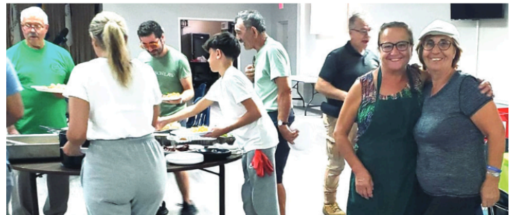
Para além da operação de limpeza, também houve convívio