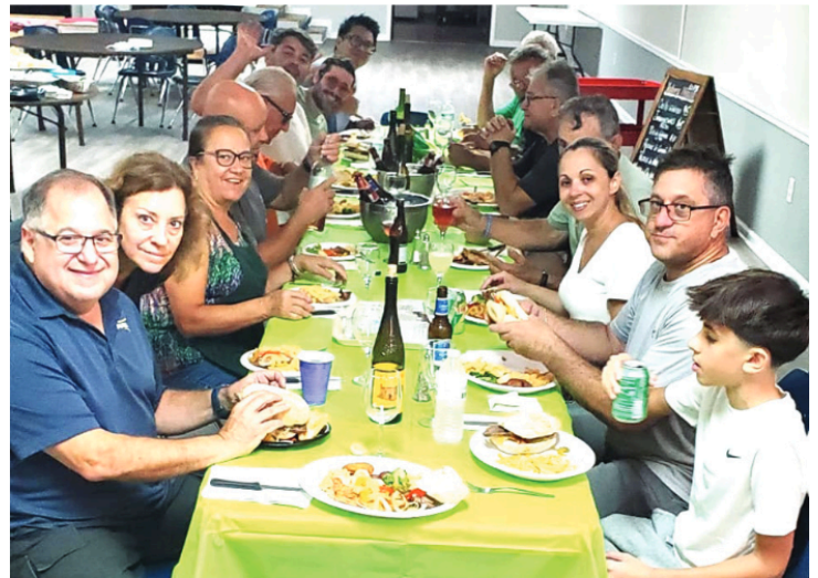
Outro aspecto da refeição que, depois da operação da limpeza e remoção de destroços, foi servida aos voluntários na sede da PASA