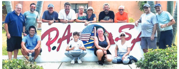
Parte da equipa de voluntários que pôs mãos à obra na PASA