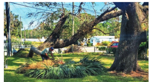
Depois da passagem do furacão Milton, foi necessária uma operação de limpeza na PASA