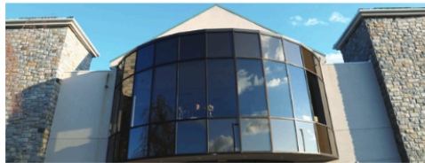
Fachada do Centro Cultural Português da cidade de Danbury, Connecticut