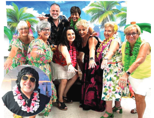
Como se depreende, a animação foi grande na noite em que o Havai veio até à PACA da cidade de Port Richey, na Flórida