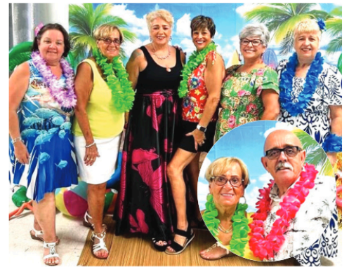
Participantes à 'Luau Party' na PACA

E assim se preenchem momentos de muita animação nas nossas comunidades.