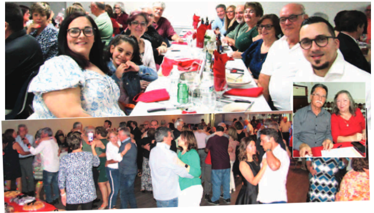
Dois aspectos do convívio que decorreu na PASA de St. Petersburg, FL

rio musical. Não menos animado foi o leilão de vários artigos.