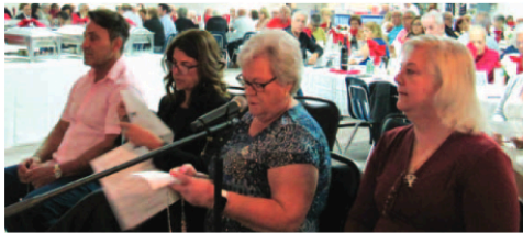
Rezando o terço com os mordomos