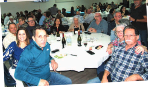
Figuras presentes ao espectáculo

Com casa esgotada, a noite de comédia na Portuguese-American Suncoast Association do passado dia 18 de Janeiro marcou o arranque do