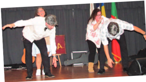
Momento da actuação interactiva dos "The Portuguese Kids" na PASA