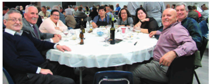
Número de participantes ao espectáculo de humor