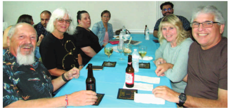
Também se confraternizou durante a noite de comédia

A realização deste evento fez uso de um formato bem desafiante para a pequena equipa de voluntários, na sintonia da preparação e venda de culinária a uma casa cheia, provando consistência com o estilo bem à portuguesa, dado ao facto de a adesão ter excedido as expectativas.