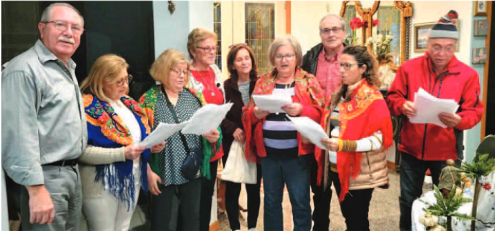
O grupo de voluntários que cantou as Janeiras em Palm Coast, FL

Dia 6 de Janeiro, celebra-se o Dia de Reis e nesta data, as pessoas vão de casa em casa cantando as "Janeiras", canções simples celebrando a chegada do Menino Jesus e os Reis que o visitaram, marcando assim o fim da quadra natalícia.