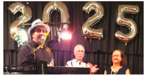
A animação musical em West Palm Beach St. Petersburg