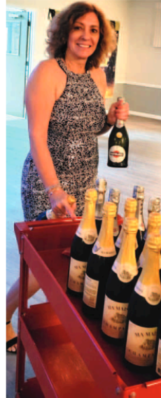
O champanhe antes da chegada de '25...

A comunidade lusa de St. Petersburg, FL celebrou a passagem de ano com pompa e requinte no passado dia 31 de Janeiro na sede da Portuguese-American Suncoast Association (PASA), com todos os preparativos liderados por uma equipa pequena mas de admirável entusiasmo e ardente paixão, que elevou os sentidos dos convivas ao