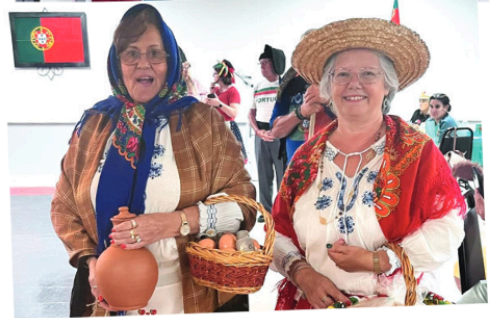
Vários aspectos dos festejos do 10 de Junho em Port Richey