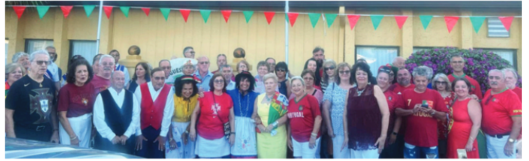
A comunidade luso-americana de Port Richey no Dia de Portugal