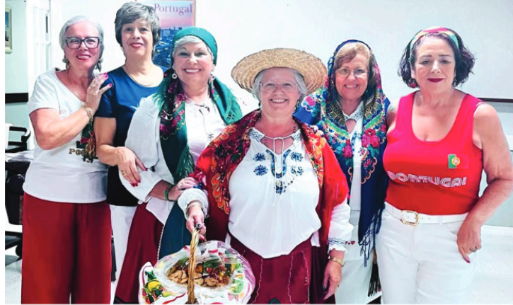
Grupo de senhoras da comunidade com trajes regionais

A comunidade de Port Richey, na Flórida, celebrou a 9 de Junho o Dia de Portugal com muita alegria, fervor e originalidade.