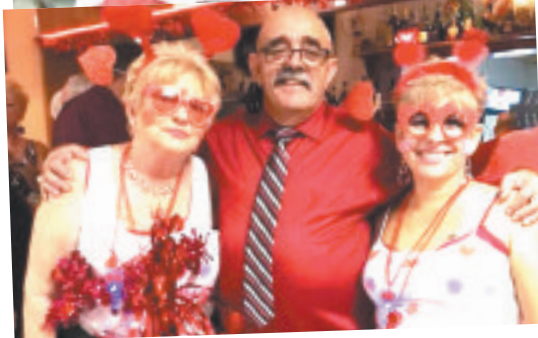
Como se pode depreender, animação foi o que não faltou na PACA de Port Richey