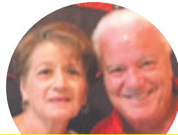
Duas presenças na festa da PACA

Faça de todos os dias da sua vida, um dia de amor ao próximo. E verá que a vida é muito melhor assim.