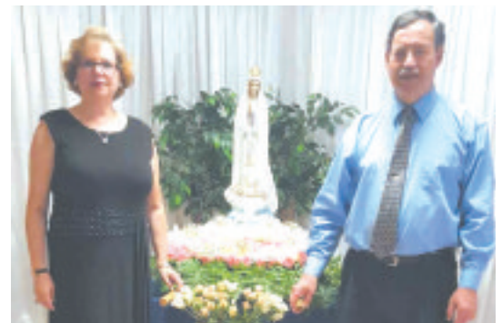
A estátua de Nossa Senhora de Fátima nas instalações da PASA em St. Petersburg, FL

Houve jantar dançante e uma procissão de velas em redor do edifício-sede da PASA, com a comunidade católica e gente de todas as fés a marcarem presença.