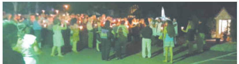
Aspecto da procissão de velas que percorreu o terreno anexo à sede da PASA

O Dia da Mãe foi comemorado na PASA de St. Petersburg no mesmo fim-de-semana em que se celebrou a festa em louvor de Nossa Senhora de Fátima.