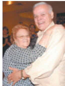
Celebrando 55 anos de matrimônio

A comunidade portuguesa de Palm Coast, o PACC e o LA desejam-lhes muitos anos de saúde, amor e amizade para os dois.