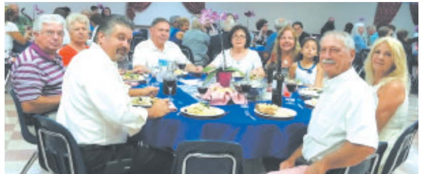
Uma das mesas de convivas no Dia da Mãe na PASA, em St. Petersburg, FL