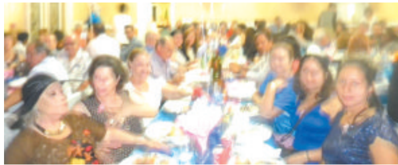
Aspecto do salão nobre da PACS na noite da festa a favor do Hospital St. Judas

A festa em benefício do Hospital St. Judas, que se dedica a crianças com can-