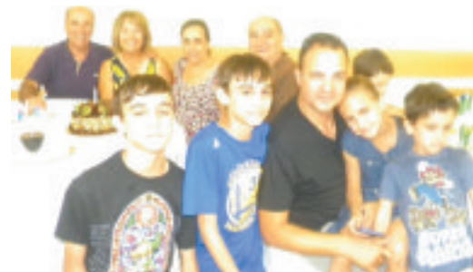
Esta família veio em peso à festa

E em continuação da boa disposição, celebraram-se vários aniversários de nas-