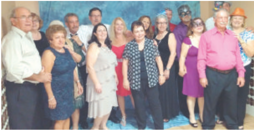
▼ A equipa de trabalho que contribuiu para o êxito da festa de passagem de ano na PASA