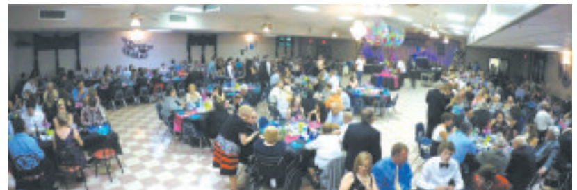
▼ Aspecto do salão de festas da PASA na noite de réveillon