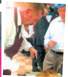
▼ A servir a carne...